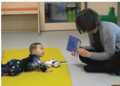
Les Matinées d'éveil