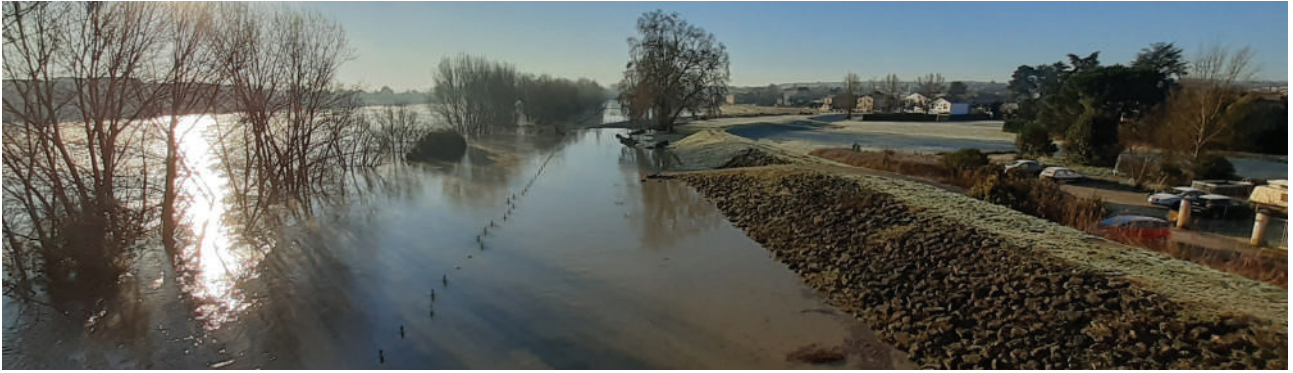
Vue amont Pont de Pierre