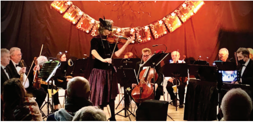
Concert du Nouvel An