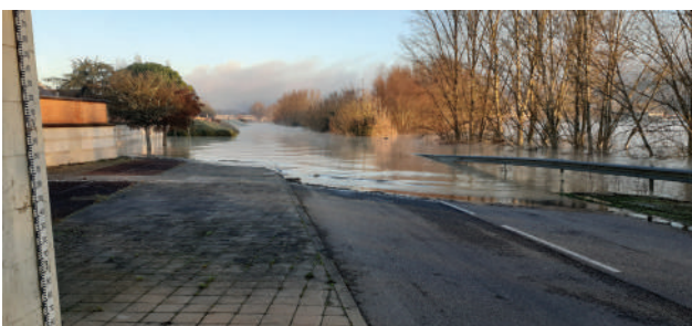
Passerelle Michel Serres