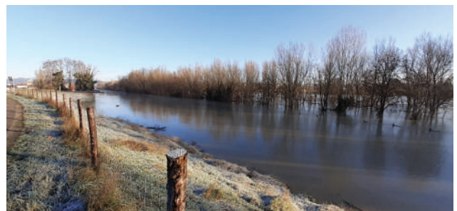
Rue de la Bénazie