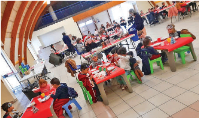
Repas-Cabaret à Rosette