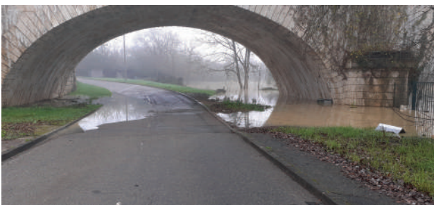
Rue Sacha Guitry

La Commune a prévenu les occupants des maisons d'habitation situées à proximité immédiate du bord de Garonne. Les agents municipaux ont, en fonction de l'évolution de la crue, procédé successivement à la fermeture préventive de la voie sur Berge et de la rue Sacha Guitry au droit du Pont Canal. La cellule « Communication » a informé régulièrement la population via le site Internet de la Ville, les réseaux sociaux et les panneaux électroniques. Dès l'annonce de la décrue, les services Techniques municipaux et les services de l'Agglomération d'Agen ont effectué, chacun en ce qui les concerne, le nettoyage de la rue Sacha Guitry et de la voie sur berge, afin de permettre le rétablissement de la circulation.