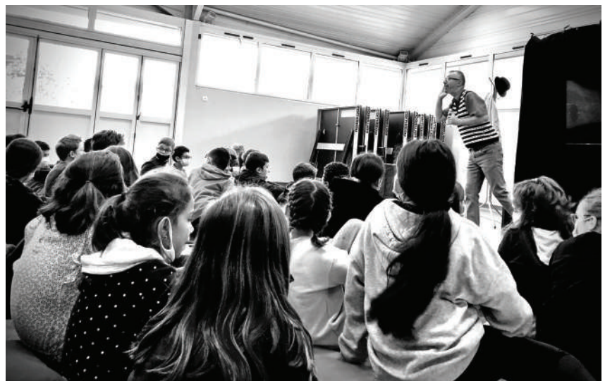
200 écoliers ont assisté à « L'étrange vie de Matt Lalucarne »

Alors que chaque « Rendez-vous des Petits » a réuni 120 spectateurs, la culture s'invitait dans les écoles de la Commune avec la pièce de théâtre « L'étrange vie de Matt Lalucarne », spectacle ludique et éducatif de la Compagnie de l'Escalier qui Monte.