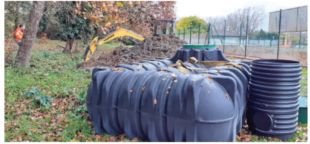
Complexe sportif Saint-Germes – captage des sources