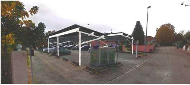
Parking rue de la Marine – projet d’ombrières