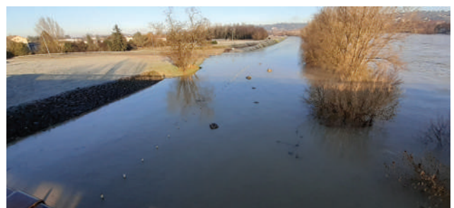
Vue aval Pont de Pierre