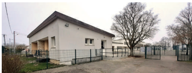
Bureau de vote n°3 : garderie école élémentaire Edouard Lacour

Afin de faciliter l'accessibilité le jour des scrutins, le bureau de vote n°3, situé initialement dans la salle de sport de l'école élémentaire Edouard Lacour, est déplacé dans la nouvelle garderie, située dans le bâtiment à l'entrée du groupe scolaire Edouard Lacour, avenue Jean-Sébastien Bach.