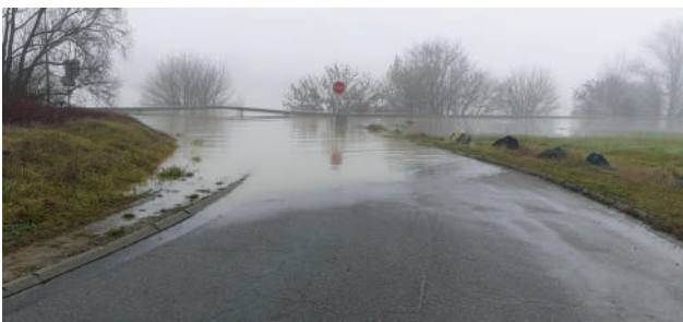
Voie sur Berge