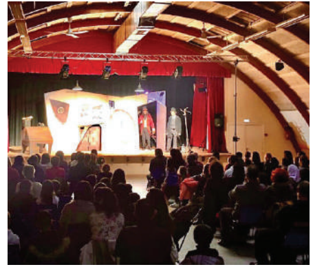
Spectacle « A Christmas Carol » offert par la Ville

A la Ferme d'Estrades, du 27 novembre au 5 décembre 2021, 200 visiteurs sont venus admirer les oeuvres de l'Exposition collégiale « Le Passage d'Agen a d'incroyables talents ».