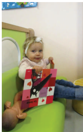
Noël au Relais Petite Enfance