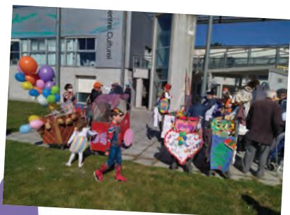
Le départ du Carnaval se prépare sur la pelouse du centre culturel