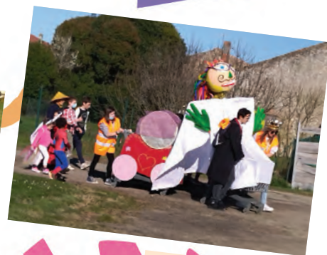
Monsieur Carnaval arrive à destination, conduit tout au long du chemin par Eloïse