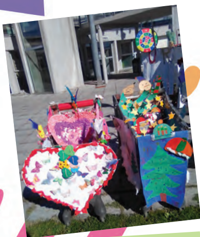
Des chariots multicolores