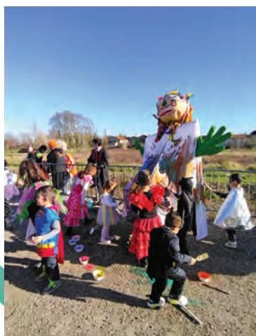
A coup de pinceau, les enfants ont rendu ses couleurs à Monsieur Carnaval pour annoncer le printemps !