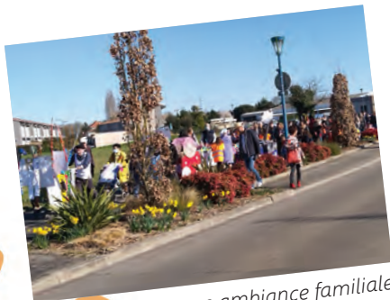
Un défilé dans une ambiance familiale et conviviale