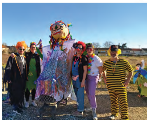
L'équipe du service Enfance-Jeunesse vous donne rendez-vous l'année prochaine !