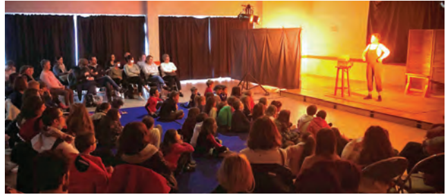
05/03/21 - Découverte du conte musical et familial « Marre, marre, marre »