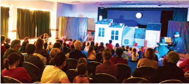
23/02/21 - Une centaine de spectateurs a assisté à la représentation du spectacle « Chapeau ».